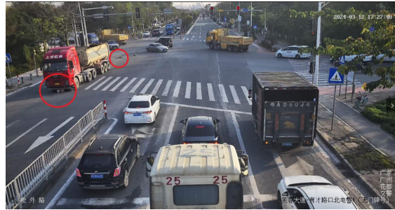
图 8(小红圈处为死者)