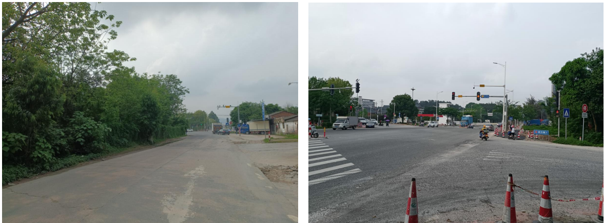
上图为育才路安全设施设置情况

(2) 育才路：设置有人行标识牌、人行交通灯、右转重型汽车停车让行标志牌等。育才路花山段路中分道线与芙蓉大道交叉路口人行横道线模糊不清。