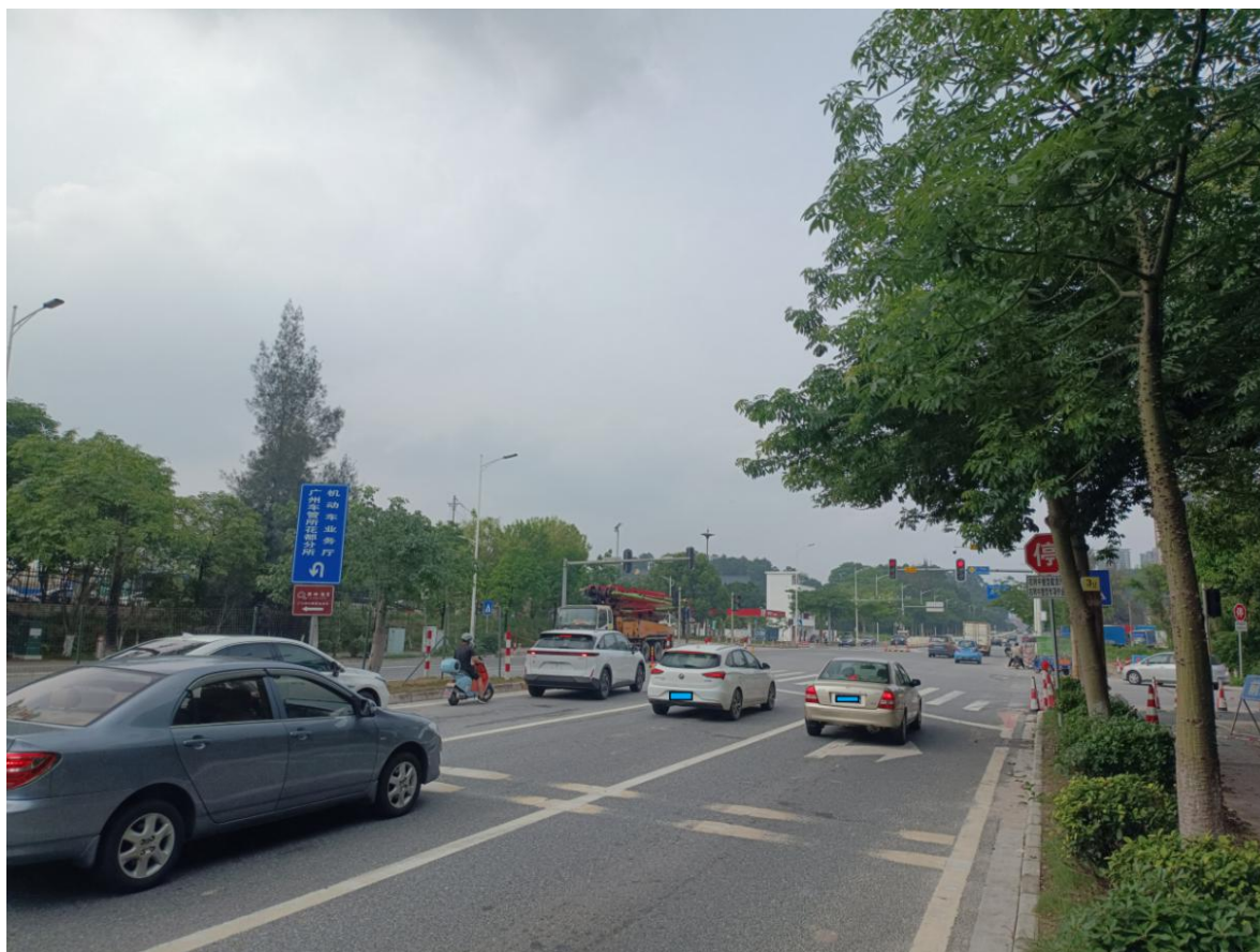
上图为芙蓉大道南往北向，交通灯处为芙蓉大道与育才路交叉路口

育才路呈东西走向，与芙蓉大道交叉路口以东路面用路中单实线分隔南北两侧路面，路中标线模糊不清，双向混合车道，路宽 8.4 米，路口路面设有人行横道标线。育才路与芙蓉大道呈“十”字型交叉，设交通信号灯控制通行，现场路口有视频监控。事故发生时，车流量一般，视线良好。