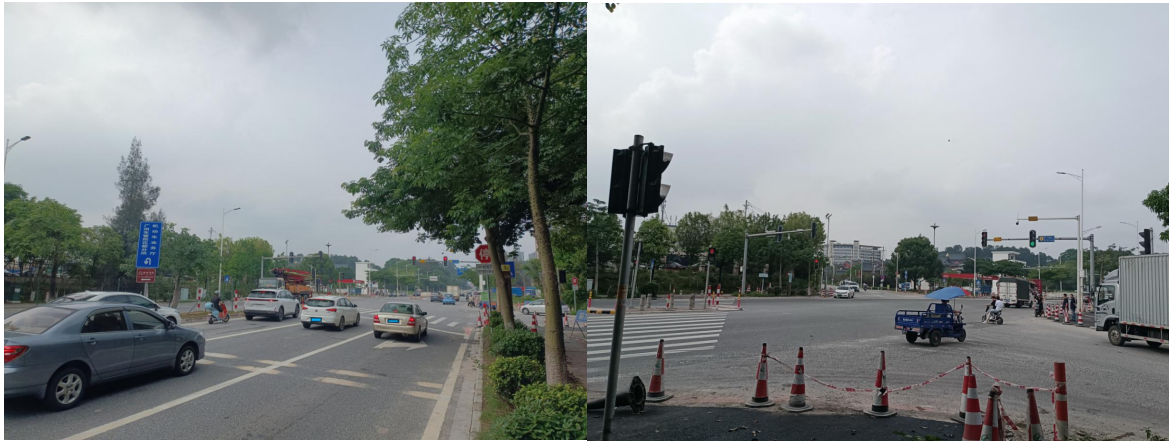
上图为芙蓉大道安全设施设置情况

(2) 育才路：设置有人行标识牌、人行交通灯、右转重型汽车停车让行标志牌等。育才路花山段路中分道线与芙蓉大道交叉路口人行横道线模糊不清。