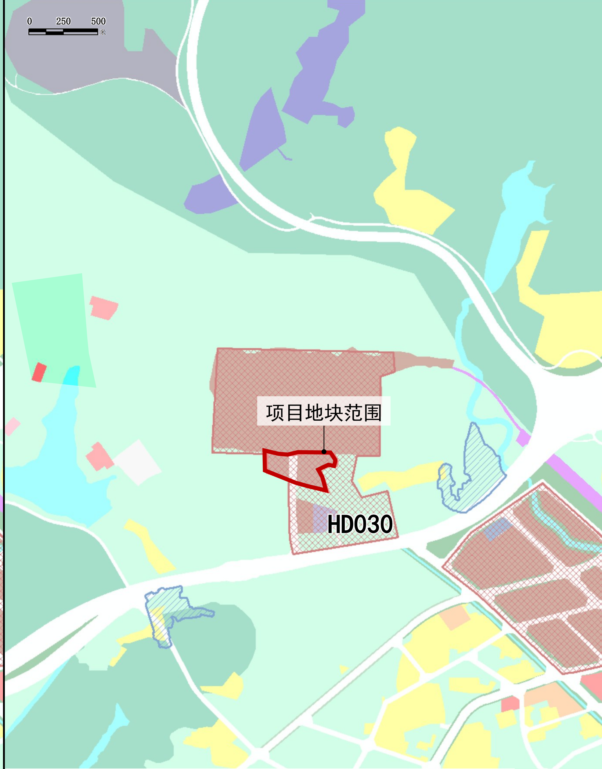
产业区块内优化后规划用地示意图