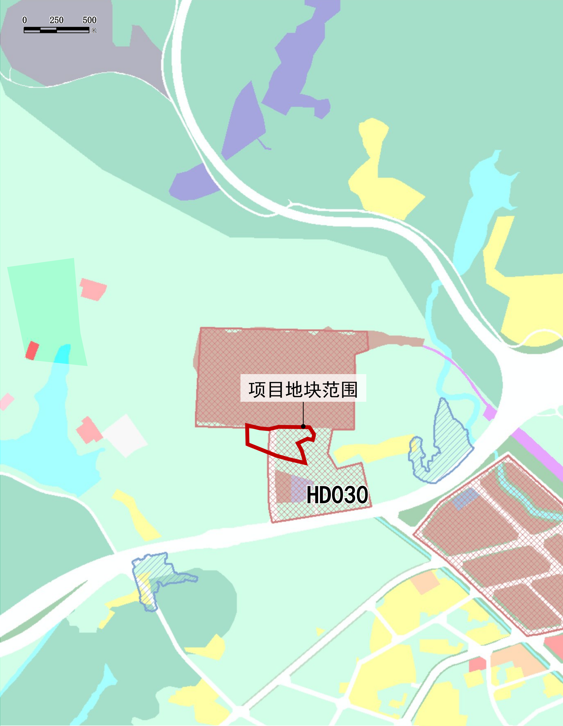
产业区块内原规划用地示意图